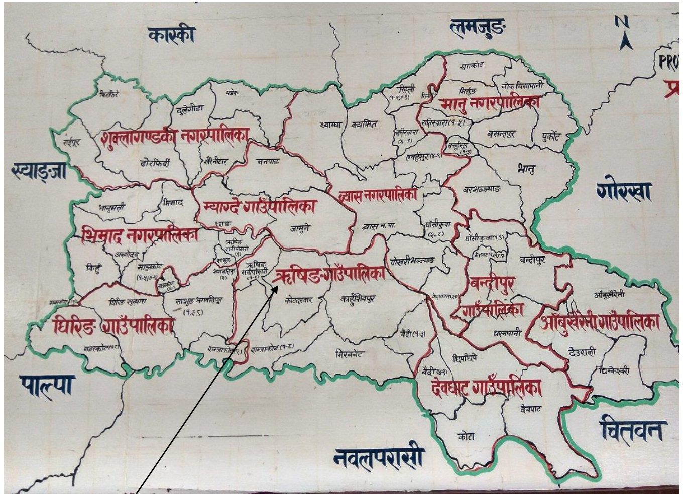
ऋषिङ गाउँपालिकाको नक्सा